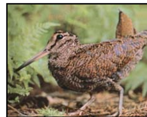
Bécasse des bois

Une SIC (en vert sur la carte). Sur ce site, on trouve des milieux forestiers très diversifiés et diverses communautés amphibies méditerranéennes, dont les exceptionnelles mares cupulaires creusées dans la rhyolite.