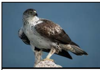
Aigle de Bonelli