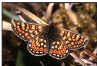
Damier de la succise