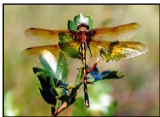
Cordulie à corps fin